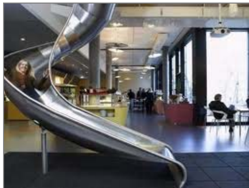
شکل ۴: یکی از دفاتر شرکت گوگل

پذیرفته که از دهان یک کاربر راضی خارج شده و او گوگل را به دیگری توصیه کرده است. (بینش، ۱۳۸۷) مشتری مداری گوگل فقط به کاربران محدود نیست. بلکه شامل کارمندان به عنوان مشتریان درون سازمانی نیز می شود.