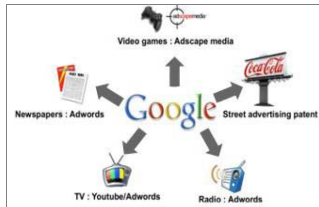
شکل ۳: مدل توسعه گوگل در بازارهای آفلاین

با همین دیدگاه گوگل خدمات تبلیغاتی خود را توسط داده و تبلیغاتی که به آن سپرده می‌شود، می‌تواند علاوه بر اینترنت در محیط‌های ذیل نیز پخش شوند: