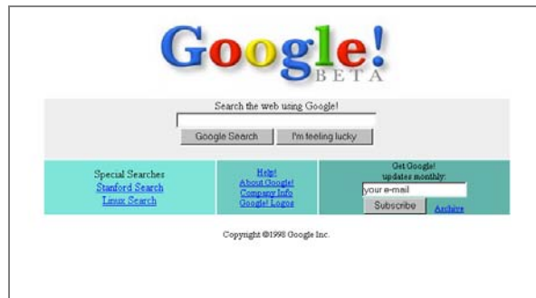
شکل ۱: اولین صفحه گوگل در سال ۱۹۹۸

می‌کرد. آشنایی او در سال ۱۹۹۵ با سرگی برین ۳ ۲۱ ساله، دانشجوی دیگر استنفورد باعث شد که با کار با سرعت بیش‌تری به پیش برود. آن‌ها معتقد بودند که موتور جستجویی که قادر باشد روابط بین وب سایت‌ها را تجزیه و تحلیل کند و فهرست نتایج به دست آمده را براساس میزان اهمیت رتبه‌بندی کند بسیار بهتر از روش جاری جستجو در آن زمان خواهد بود. در سال ۱۹۹۶ نام موتور جستجو خود را Rub Back انتخاب کردند، زیرا سیستم طراحی شده به گونه‌ای بود که پیوندهای پس پرده را برای تشخیص اهمیت و منزلت سایت موردبررسی قرار می‌داد. این موتور جستجو با آدرس google.stanford.edu کار خود را بر روی سرورهای دانشگاه آغاز کرد. نهایتاً در سال ۱۹۹۸ میلادی، آقایان لاری پیج و سرگی برین شرکت گوگل را ثبت و سایت را رسماً افتتاح کردند. (Google, 2011a)